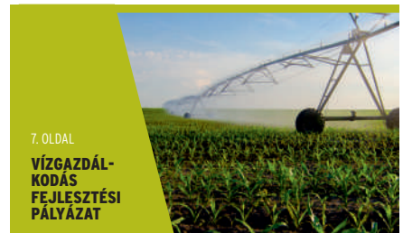
7. OLDAL VÍZGAZDÁLKODÁS FEJLESZTÉSI PÁLYAZAT