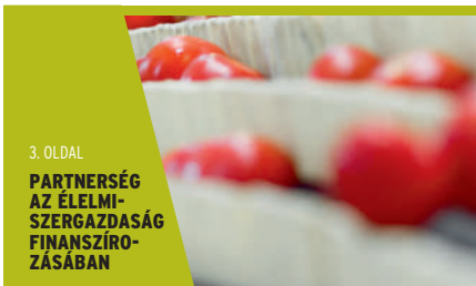
3. OLDAL PARTNERSÉG AZ ÉLELMISZERGAZDASÁG FINANSZÍROZÁSÁBAN