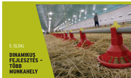
5. OLDAL DINAMIKUS FEJLESZTÉS - TÖBB MUNKAHELY