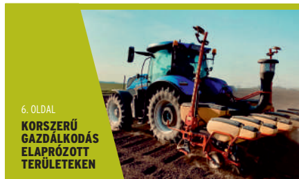
6. OLDAL KORSZERŰ GAZDÁLKODÁS ELAPRÓZOTT TERÜLETEKEN