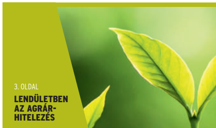
3. OLDAL LENDÜLETBEN AZ AGRÁR- HITELEZÉS