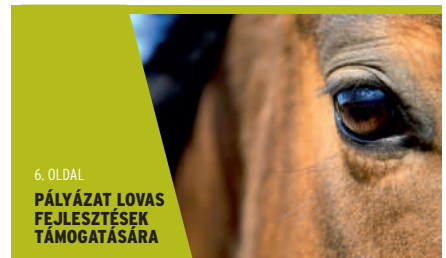
6. OLDAL PÁLYÁZAT LOVAS FEJLESZTÉSEK TÁMOGATÁSÁRA