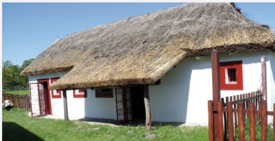
Felújítás alatt a „szegény legény ház”