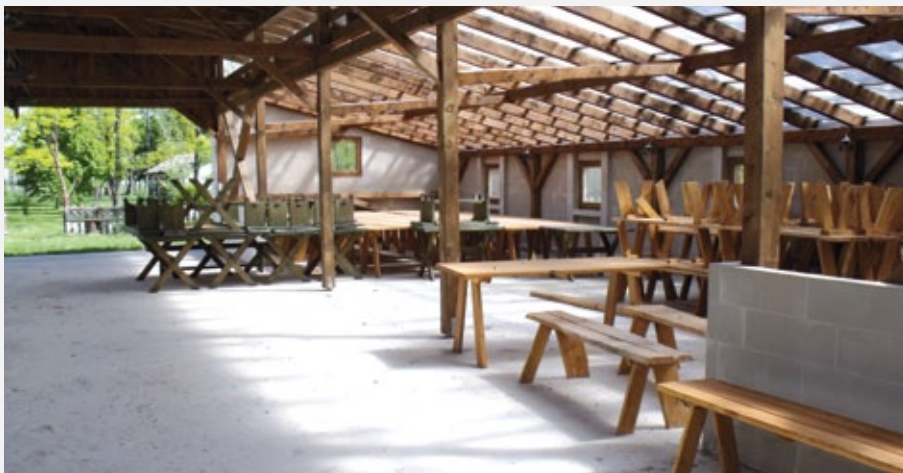
Az épülő nyári csárda

Hívja a 06 40 200 771 -es kék számot, vagy keressen minket a tanacsadas@avhakft.hu e-mail címen.